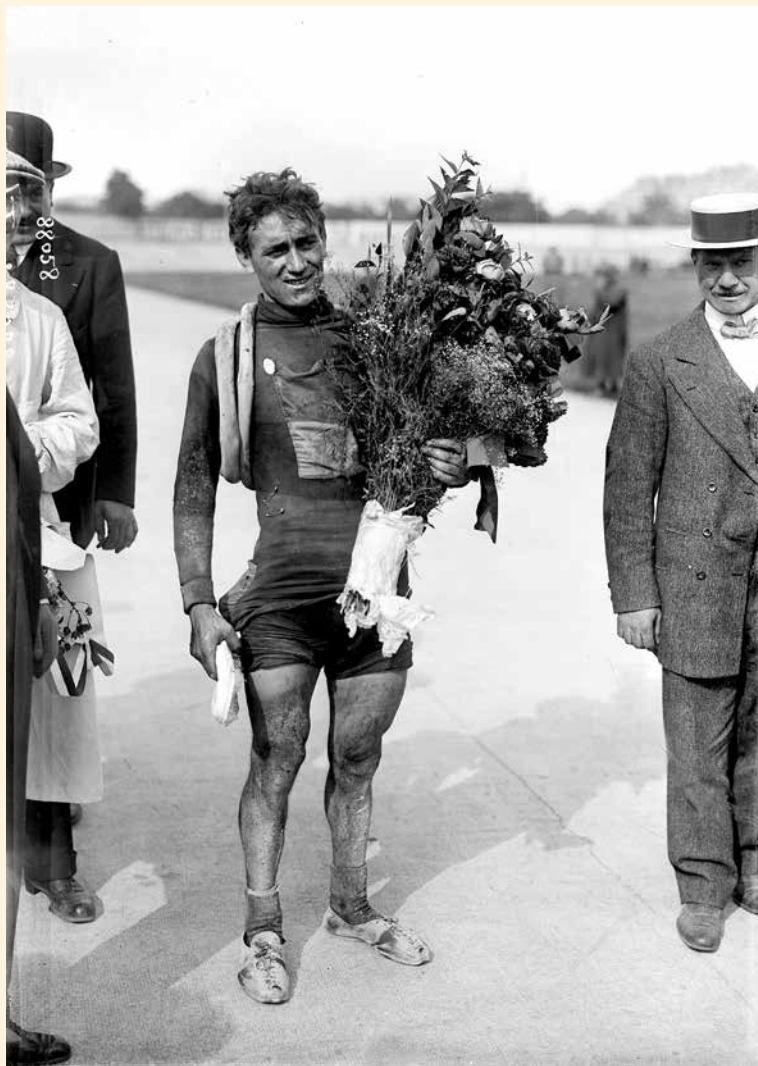
Philippe Thys. Lídři byli prokletí, on vyhrál.

V oficiálních publikacích Tour nikdy nebude veden jako první muž ve žlutém trikotu. Žádná taková jeho fotografie ani neexistuje, oficiální