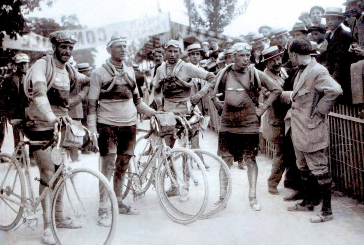
Připraveni. Na startu etapy Tour 1913.

Pak při Tour 1912 exceluje v etapě z Chamonix do Grenoble. Jeho 315 kilometrů trvajícím sálovým únikem zůstane nejdelším v historii závodu.