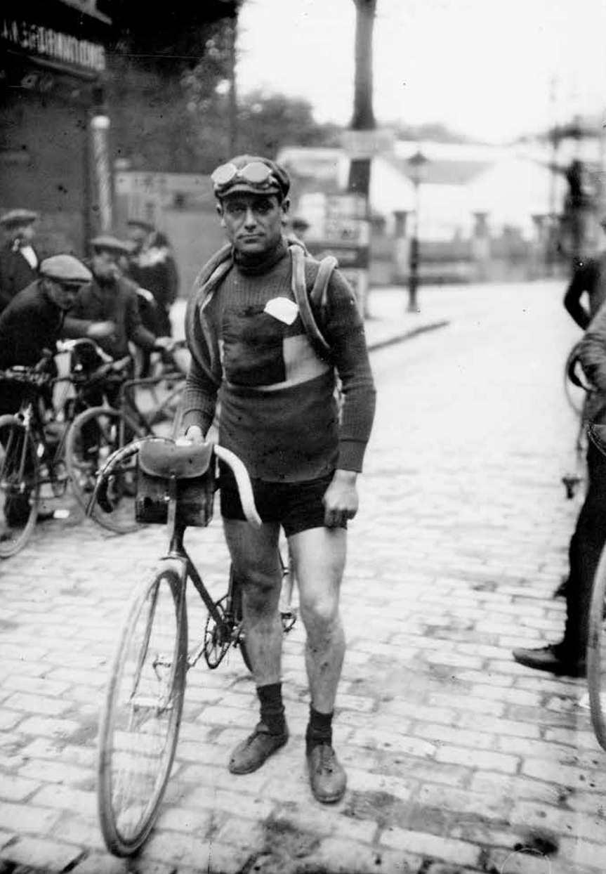
Cri-Cri. Eugène Christophe, pantičkář, extrémista a symbol předválečné Tour.

Pobudou tam dalších 25 minut. Christophe okny sleduje, jak mezitím projeli kolem čtyři cyklisté. Rozhodne se pokračovat.