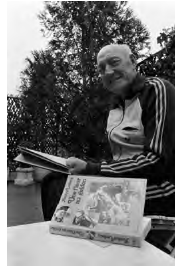
Tak jsem to sepsal. André Leducq představuje v roce 1978 svou autobiografii.

pokličkou oslavujícího týmu to vře. Copak si ten zelenáč zaslouží, aby pobral tolik slávy?