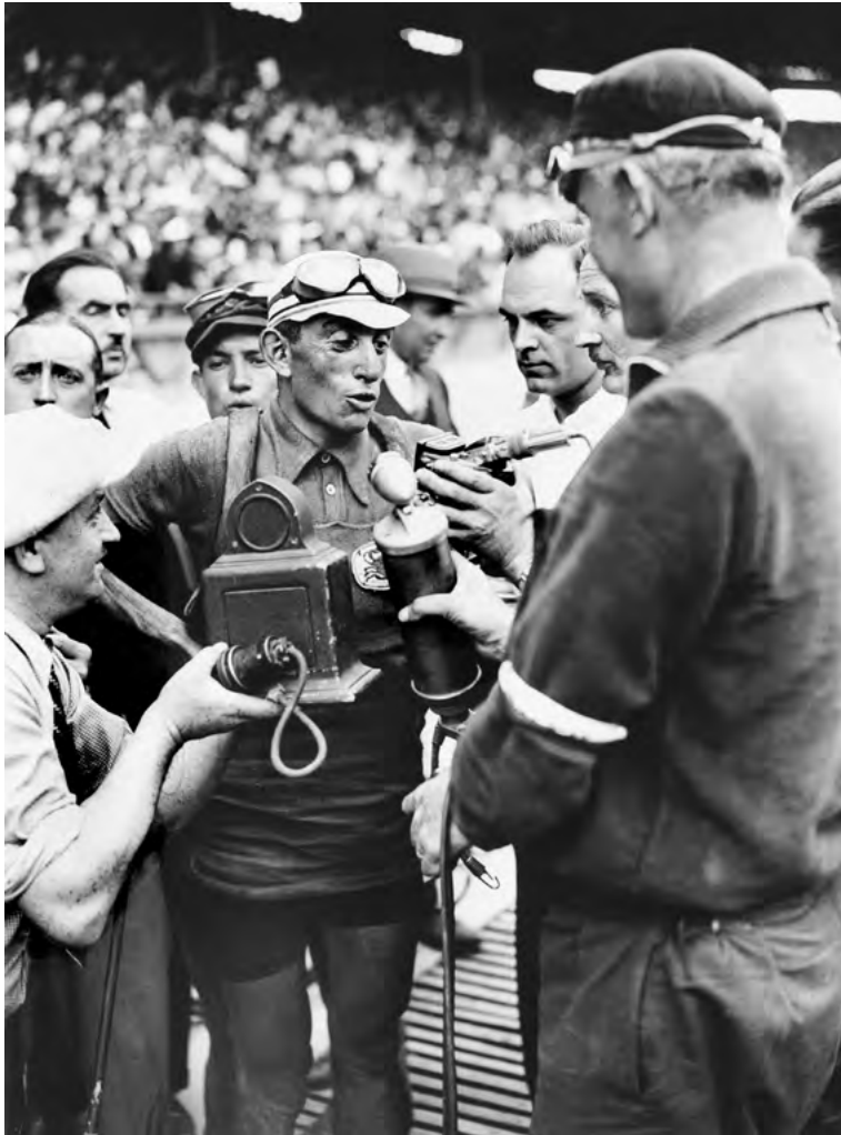
V obležení reportérů. Léto 1934, Antonin Magne je podruhé vítězně v Paříži.