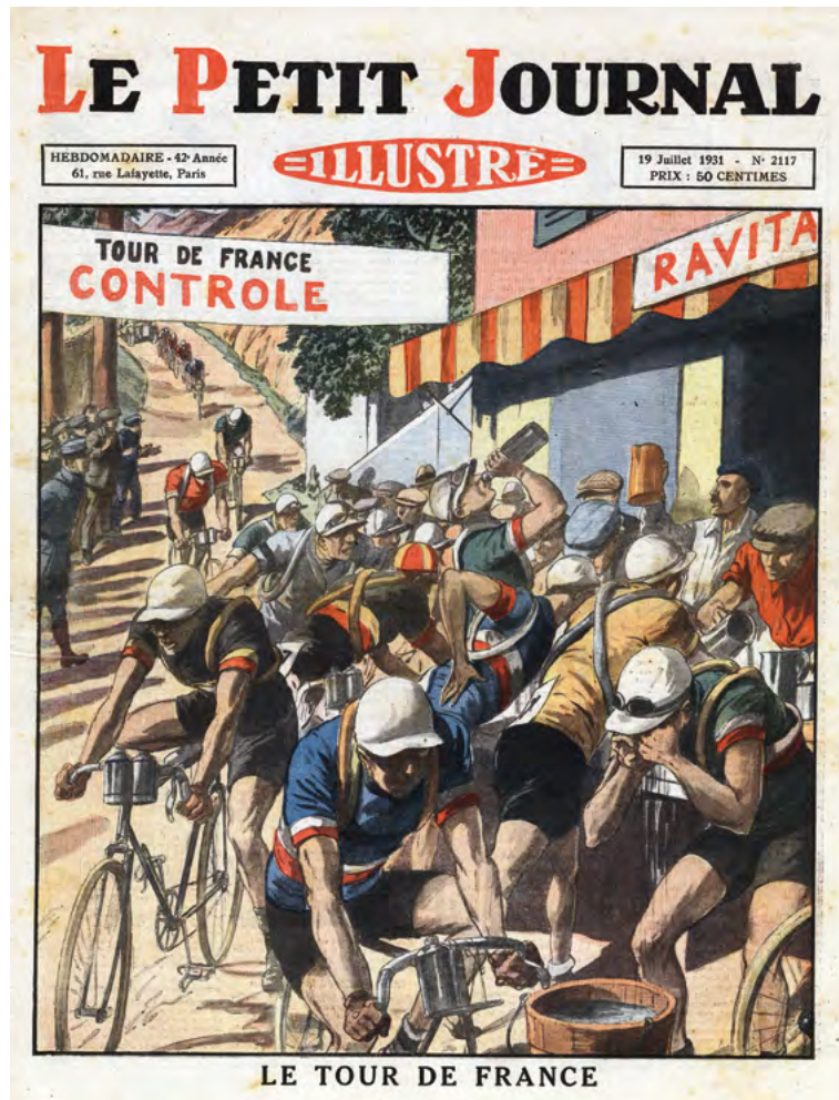
Vodu, vodu, vodu. Občerstvení na Tour 1931.

Leducq poctivě trénuje, protože pochopil, že cyklistické úspěchy jsou pro něj cestou ke krásnému životu, o němž snil, i ke krásným dívkám.